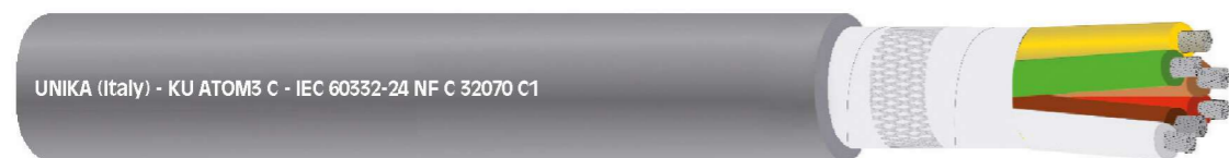
UNIKA (Italy) - KU ATOM3 C - IEC 60332-24 NF C 32070 C1

Cavi di controllo schermati con tensione 300/500 V per impianti nucleari Control screened cables rated 300/500 V for nuclear plants